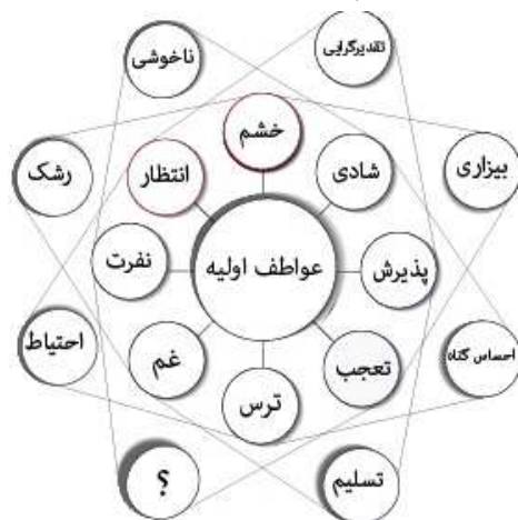
شکل شماره (۴) عواطف ترکیبی دوتایی نوع سوم

این ترکیب برای پلاچیک هم مبهم است. البته در این باره تنها اینقدر می‌توان گفت که عاطفه به دست آمده از این ترکیب هم عاطفه منفی خواهد بود: