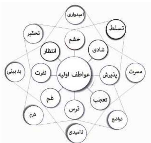
شکل شماره (۳) عواطف ترکیبی دوتایی نوع دوم

به همین ترتیب هشت عاطفه اولیه قابلیت ترکیب نوع دوم، یعنی یک در میان را هم دارند. اگر عواطف به صورت یک در میان با هم ترکیب شوند، نتیجه را یک ترکیب دوتایی نوع دوم نامند: