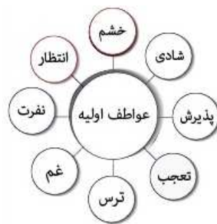
شکل شماره (۱) عواطف اولیه

سازگاری و انطباق بیولوژیکی هستند، شرح می‌دهد که این ابعاد مختلف عبارتند از: بعد تخریب، دفاع، جذب، دفع، تولید مثل، محرومیت، جهت‌یابی و اکتشاف. به نظر می‌رسد که این ابعاد عاطفی شامل مجموعه‌ای از محورهای دو قطبی از قبیل تخریب در مقابل دفاع، جذب در برابر دفع، تولید مثل در برابر محرومیت، جهت‌گیری در مقابل اکتشاف باشند. اگر در مورد این اصطلاحاتی که برای توصیف این عواطف اولیه در انسان به کار می‌رود، بیندیشیم، مفهوم دو قطبی بودن آن‌ها برای ما روشن‌تر خواهد شد. در نظر ما شادی در برابر غم، پذیرش در مقابل تنفر، خشم در برابر ترس و تعجب در مقابل انتظار مطرح می‌شود (پلاچیک، ۱۳۷۵: ۱۲۹):