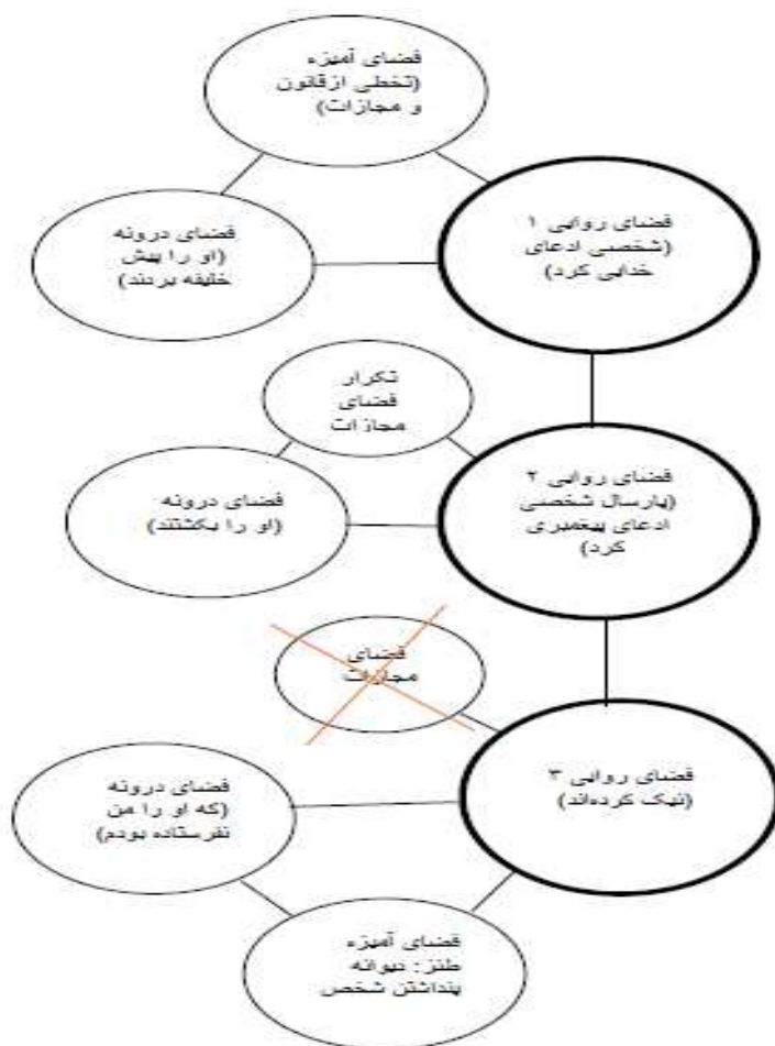
شکل ۵ - فضاهای ذهنی حکایت رساله دلگشا